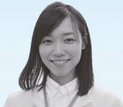
総務課住民係 主事

全てが初めての事なので、皆さまにご迷惑をかける事が多々あると思いますが、社会人として自分の行動や言動に責任を持ち、精一杯保健師として村民の皆様の健康を支えていきたいと思っておりますので宜しくお願いします。