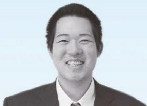
保健福祉課 保健師