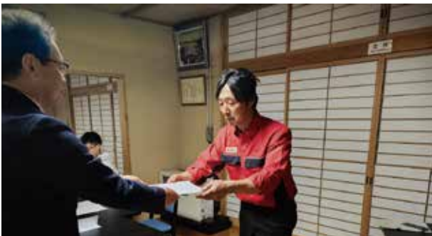
スポーツ推進委員の委嘱状交付の様子