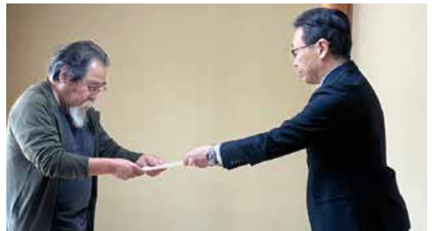
文化財保護審議会委員委嘱状交付の様子